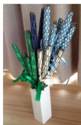
↑ラベンダースティック