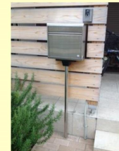
↑新品のステンレスポスト